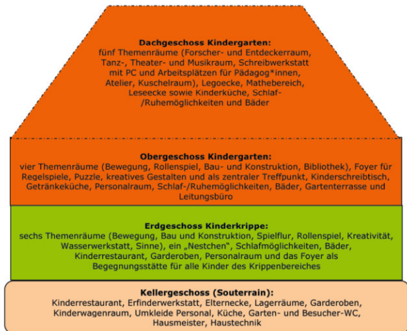
Abbildung 1: Hausstruktur der Kita

Im Außengelände gibt es zwei Sandspielflächen mit Matschanlagen. Eine Fahrstrecke lädt zum Rollen und Fahren mit Fahrzeugen ein. Unser „Wäldchen“ aus Rhododendronbüschen bieten Platz zum Verstecken. Verschiedene Materialien auf der Holzbaustelle regen die Kinder an, immer neue Spiellandschaften zu schaffen. Kletterspinne, Trampolin, Kriechtunnel und Nestschaukel eröffnen vielseitige Bewegungsmöglichkeiten für Groß und Klein.